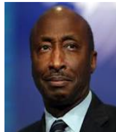
Kenneth Frazier CEO Merck & Co