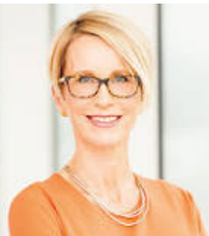
emma walmsley ceo GlaxoSmithKline