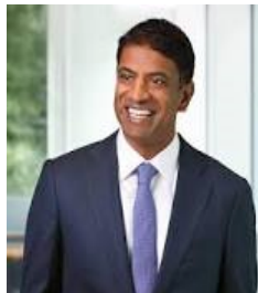
Vasant Narasimhan Ricks Ceo novartis eli Lilly